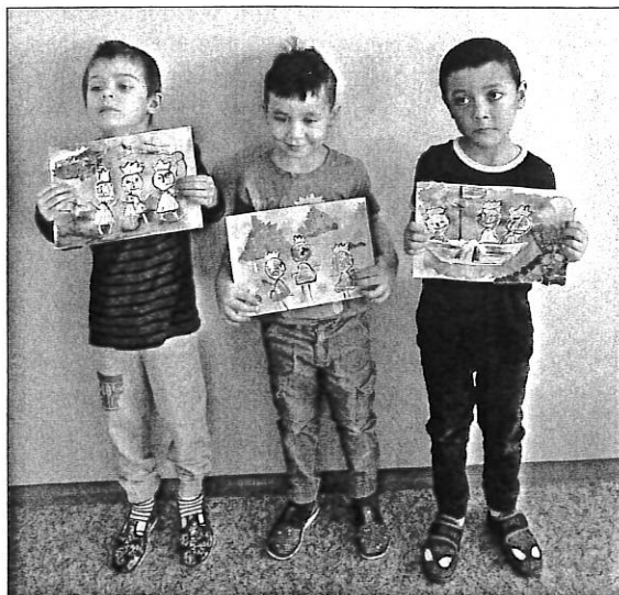
Malíři se svými díly