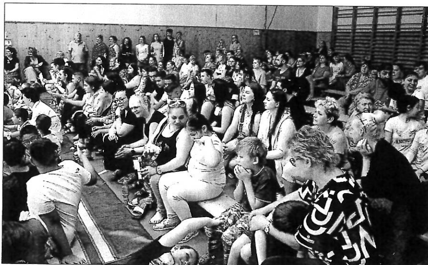
Zaplněná školní tělocvična