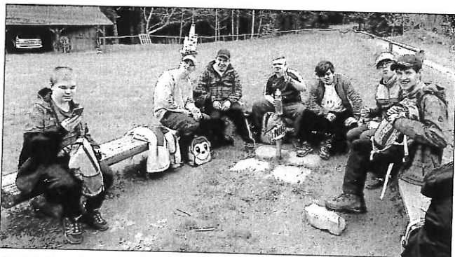
Svačinka u Valašského okénka

A víte co? Počasí bylo ukázkové a viditelnost skvělá. Pár kapek spadlo, až když se za námi zavřely dveře autobusu, který nás odvezl zpět ke škole. Unavené, ale moc spokojené.