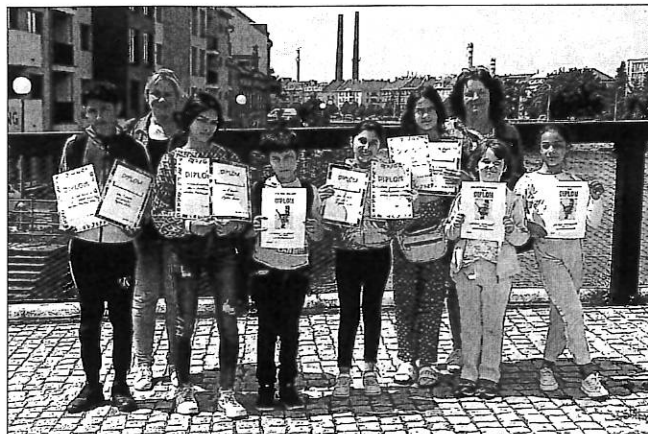
Soutěžní výprava se svými diplomy

Ve středu 14. června odcestoval výběr našich nejlepších žáků základní školy do Přerova na vědomostní soutěže. Pro děti prvních, druhých a třetích tříd to byl „Zvědavý Neználek“. Spolu s na-