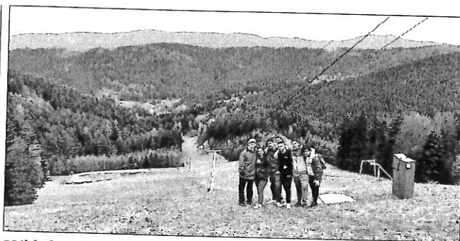
Výhled nad sjezdovkou na Beskydy

Před naším druhým školním výletem do lůna horské přírody byla předpověď počasí velmi příznivá. A sluníčko nám opravdu zachovalo přízeň. V úterý 23. května ráno jsme před školou nasedli do autobusu a vydali se vstříc dalšímu cestovatelskému dobrodružství.