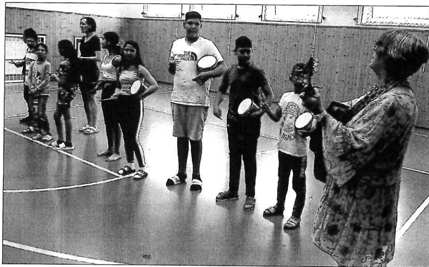
Zpěváci z V. třídy

V pestrém doprovodném programu se představila většina dětí z naší školy. Taneční skupina „Super holky“ při školní družině s vychovatelkou J. Lošťákovou nám zatančila. Děti z II. třídy pod vedením učitelky J. Tóthové nás sborovou recitací provedly celým školním rokem. Své síly spojili zpěváci z V. třídy s dětmi ze speciálních tříd, které postavily krásnou zeď při společném zpěvu písně „Dělání“. Děti z mateřské školy opět roztomilě, procvičily si rytmickou