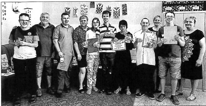
Absolventi se svými třídními učiteli a asistentkami

V červnu zakončilo studium na praktické škole sedm žáků. V pondělí 5. června přišli do školy, aby vykonali praktickou závěrečnou zkoušku z odborného předmětu. Žáci dvouleté praktické školy vyráběli z keramické hlíny misku na pochutiny. Na jednoleté praktické škole v rámci předmětu „pomocné práce ve stravování“ umíchali žáci pomazánku na jednohubky a v předmětu „základy lidových řemesel“ v košíkářství upletli misku z pedigu.