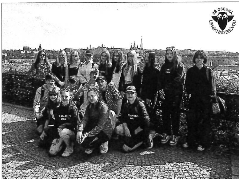
Devětáci ze ZŠ Osecká navštívili Prahu.

Po občerstvení v Palladiu se žáci vydali kolem Obecního domu na Václavské náměstí. Lucerna a pamětní deska Jana Palacha na místě, kde se upálil, byly posledními zastávkami. Ve večerních hodinách dorazili devětáci zpět do Lipníka. Libuše Procházková