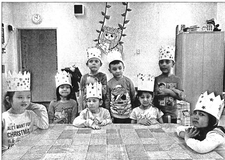
Plná školka králů