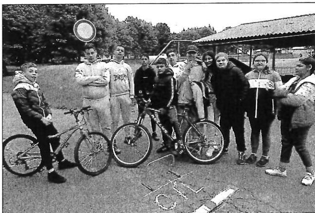
Žáci 6. a 7. ročníku před jízdami zručnosti