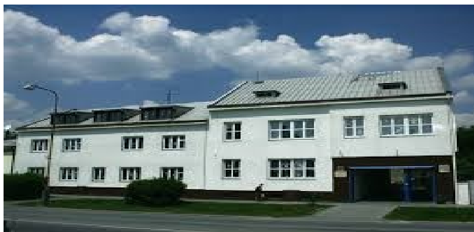
Střední škola, Základní škola a Mateřská škola Lipník nad Bečvou, Osecká 301