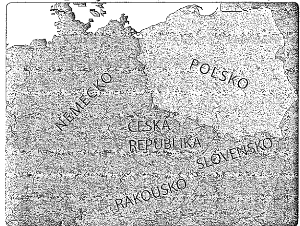
Česká republika a její sousední státy