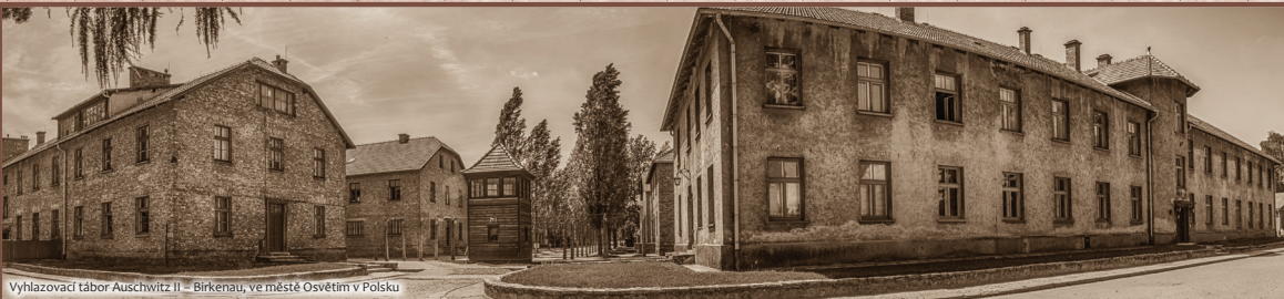
Vyhlazovací tábor Auschwitz II - Birkenau, ve městě Osvětim v Polsku

V dubnu 1944 byl jako první tábor osvobozen spojeneckými vojáky Majdanek, v lednu 1945 osvětimský tábor a posledním byl tábor v Mauthausenu v květnu 1945. Zůstalo v nich mnoho polomrtvých vězňů, nespálených těl a dalších důkazů zvěrstev páchaných nacisty. Mnoho táborů muselo být spáleno, aby se zabránilo šíření nemocí, jako byly tyfus, diftérie nebo malárie.