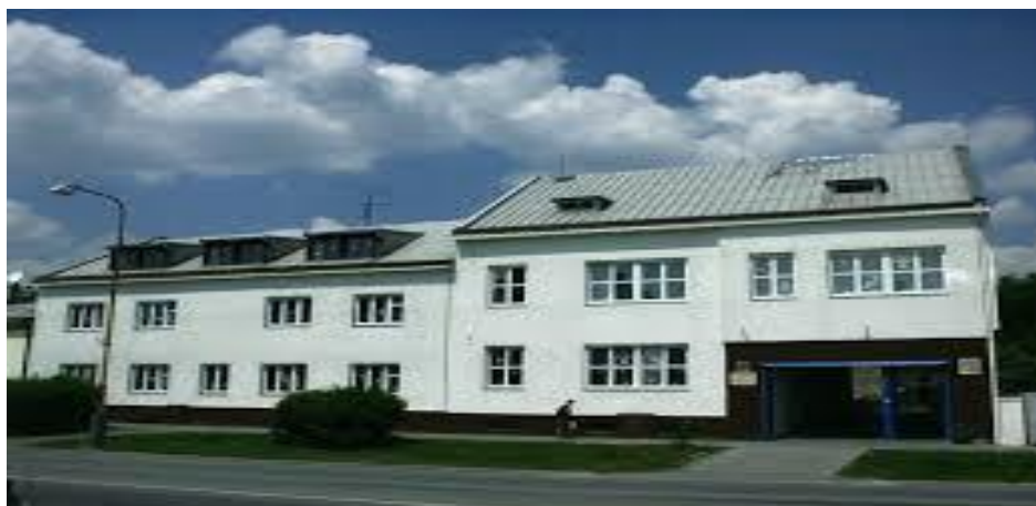
Střední škola, Základní škola a Mateřská škola Lipník nad Bečvou, Osecká 301