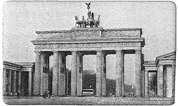
Berlín – Braniborská brána

Německo je naším největším a nejlidnatějším sousedem. (Je čtyřikrát větší než Česká republika.)