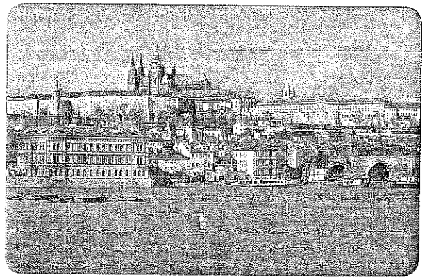
Praha – hlavní město České republiky