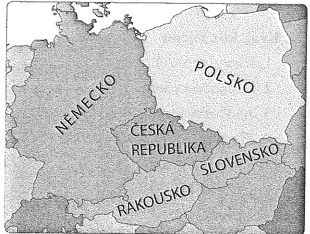
Česká republika a její sousední státy

Českou republiku řídí členové vlády, poslanci a senátoři . Nejvyšším představitelem státu je prezident . Podle státního zřízení je náš stát republika .