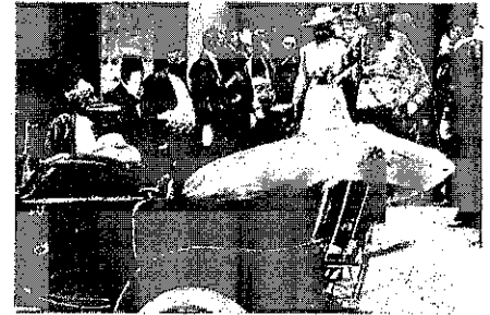
Následník trůnu s manželkou v Sarajevu 28. června 1914, krátce před atentátem

4. Ve které zemi leží Sarajevo? Vyhledej na mapě a písemně odpověz.