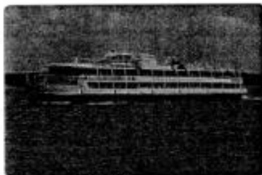
osobní lodní doprava na řece Volze

V Evropě se nachází velké množství jezer. Největší je Ladožské jezero v Rusku.