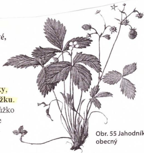
Obr. 55 Jahodník obecný

Jahodník obecný (obr. 55) patří mezi růžovité byliny. Přízemní listy jsou řapíkaté, trojčetné. Z oddenků vyrůstají květonosné stonky. Květy mají 5 bílých korunních a 5 zelených kališních lístků (menším zeleným lístkům se říká kališek). Tyčinek i pestíků je mnoho. Plodem jsou nažky, které vyrůstají na zdužnatělém květním lůžku. Jahoda, kterou jíme, je zdužnatělé květní lůžko s nažkami. Velkoplodé jahodníky pěstujeme v zahradách a rostliny rozmnožujeme vegetativně – šlahouny.