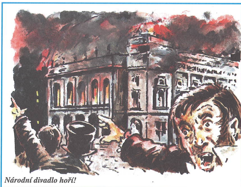
Národní divadlo hoří!