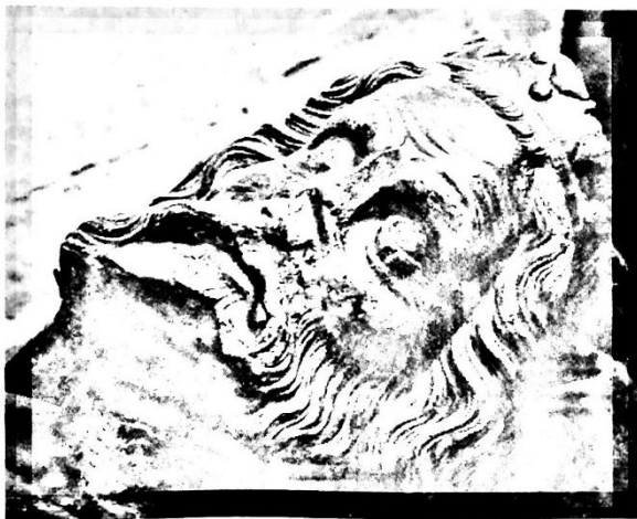
Náhrobek Přemysla Otakara I.

Přemysl Otakar I. a jeho syn Václav I. upevnili moc králů i přes odpor šlechty, která si nepřála silného panovníka (chtěla totiž svůj podíl na moci), takže Václav I. mohl začít expandovat na jih . V tom velmi úspěšně pokračoval Václavův syn Přemysl Otakar II.