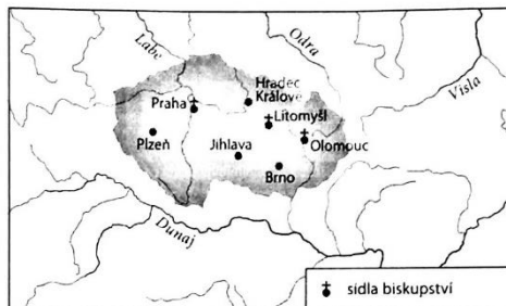
Český stát za Přemysla Otakara I. a Václava I.

Přemysl Otakar II. vládl v letech 1253–1278. Zahraničními výboji dokázal rozšířit český stát až k Jaderskému moři. K českým zemím připojil Chebsko, Rakousy, Korutany, Štýrsko a další území. Jak