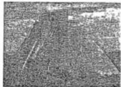
Taková Čarodějova pyramida, jedna z nejstarších mayských kultovních míst

☒ Když si uděláte o Mayích, Aztéckých a Incích referát, dozvíte se o nich mnohem více zajímavostí. Zkuste také zjistit, kdo byli Toltékové a Olmékové.