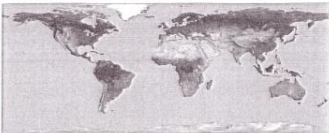
Rozložení vody na zemském (satelitní snímek)

Zemský povrch pokrývá přibližně ze tří čtvrtin voda. Voda je rozložena nerovnoměrně. Většinu (asi 97%) tvoří voda slaná, dále 2% představuje voda v podobě ledu a sněhu. Použitelné je tedy přibližně 1% vody, kterou člověk využívá pro svoji potřebu.