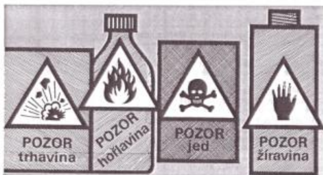
Obr. 3 Označení trhaviny, hořlaviny, jedu a žíraviny

V běžném životě se setkáváme s mnoha látkami, které mají pro člověka nebezpečné vlastnosti. Patří k nim trhaviny, žíraviny, hořlaviny a jedy.